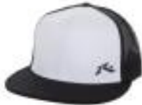
snapback visière plate