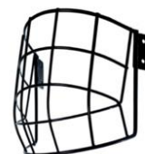
Grille de protection (en option)

Exemplaires max : 6 casques Tarif PRO : 28 ttc Tarif AFKite 15 € Possibilité d'obtenir une grille pour l'enseignement du foil Tarif public : 20 € Tarif AFKite 5 €